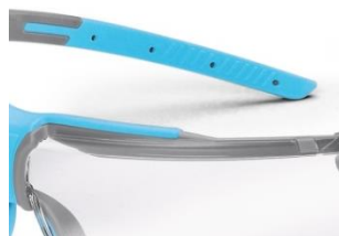
Branches et embouts Softflex