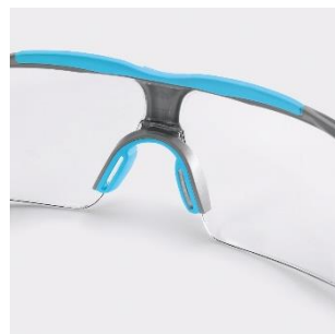
Pont de nez souple